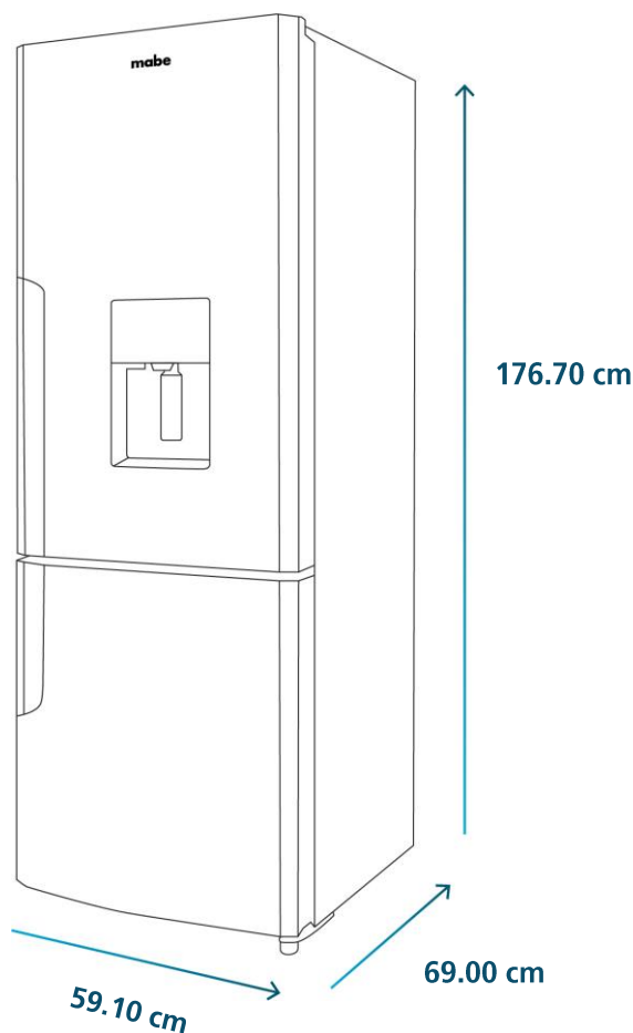
Diagrama y medidas de instalación