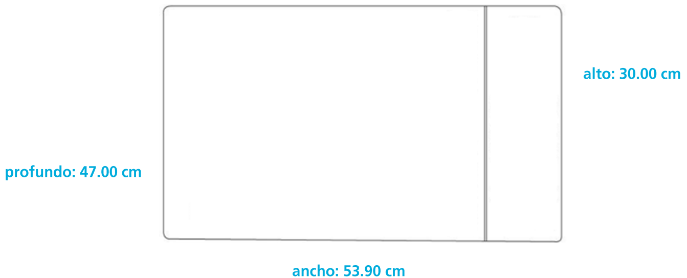
Diagrama y medidas de instalación