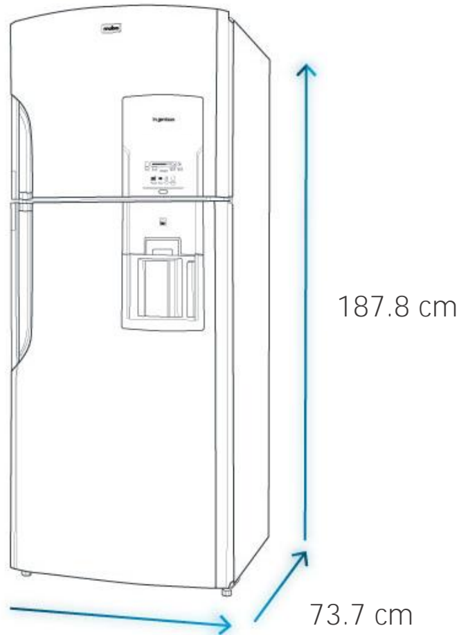
Diagrama y medidas de instalación